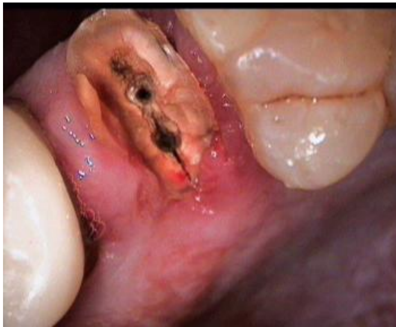
24 FELURE DE RACINE IMPLANT ENVISAGE AVEC COMPLEMENT DE SINUS