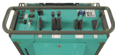
Console de contrôle et commandes intuitives